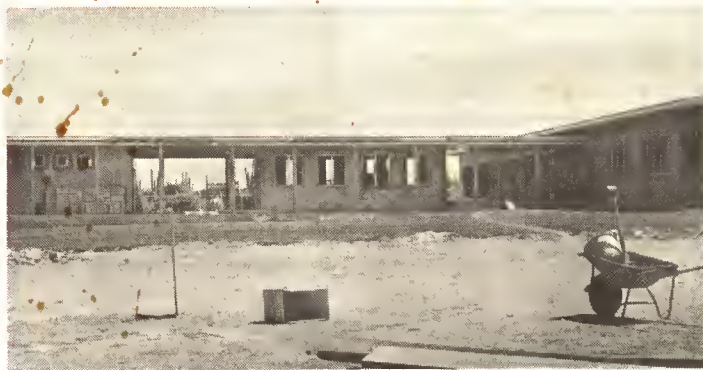
E school aki na Piedra Plat ta un di e dos schoolnan nobo di BLO cu lo bin clá na september próximo. E otro school lo bin na Cura Cabai. E cantidad di schoolnan di BLO lo ser redoblá y Aruba lo tin en total cuater di e clase di schoolnan aki. Fuera di e dos schoolnan aki, muy pronto 5 otro school nobo lo bin clá na: Dakota, Lago Heights, Santa Cruz, Santa Helena y Congoweg.